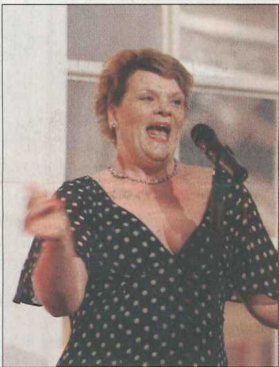
Gayle Tufts, Autorin, Sänderein und Stand-up Comedian mit "Miss Amerika"

Die transatlantische Partnerschaft und die deutsch-amerikanische Freundschaft standen im Mittelpunkt des 17. Europa-Abends des AGA am 1. November im Atlantic-Hotel. Festredner war William R. Timken jr., Botschafter der Vereinigten Staaten von Amerika in Deutschland.